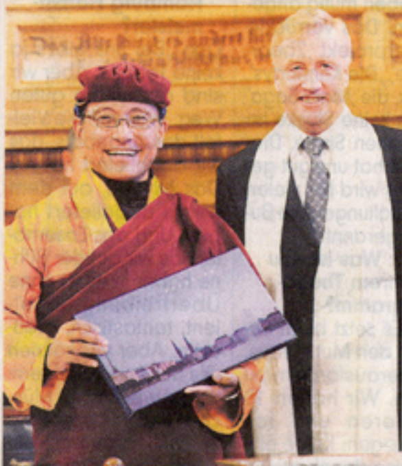
Tauschen Bilderbuch gegen buddhistischen Schal: der 12. Gyalwang Drukpa und Bürgermeister Ole von Beust