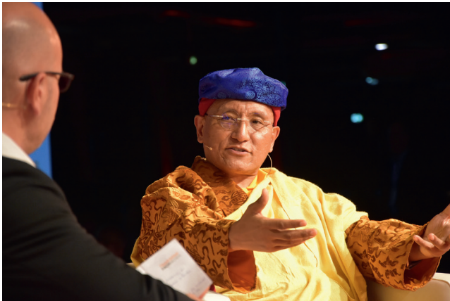
Hier gehört noch eine schöne Bildunterschrift hin.