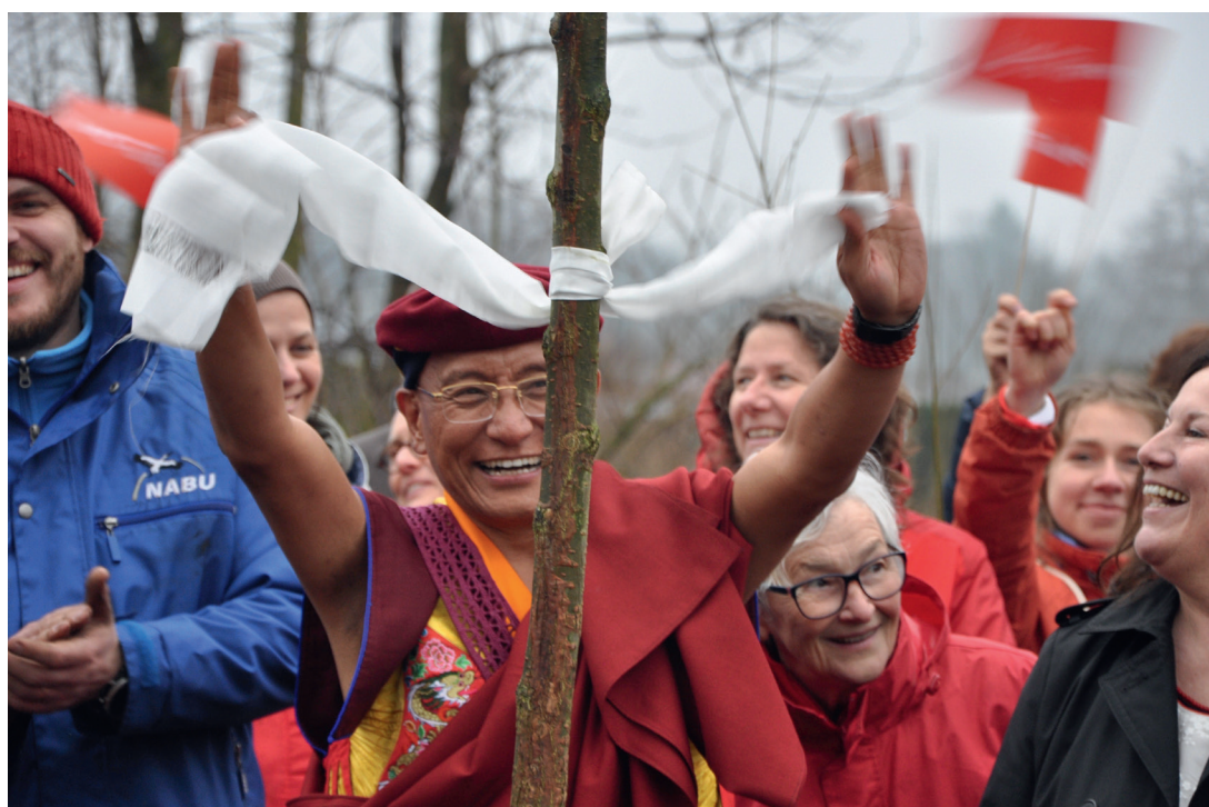
BU ergänzen Bäume pflanzen für den Klimaschutz...

Wir alle wissen, dass wir glücklich sein müssen, aber wie wird man glücklich? Das ist hier die Frage. Man sollte andere Menschen glücklich machen, damit man selbst glücklich ist. Wenn man einen Baum glücklich macht, gibt einem der Baum ein gesundes Leben. Also sollte man sich ebenso um die Bäume kümmern, man sollte sich um das Wasser kümmern, so wie man sich um sich selbst kümmert. Wenn man für deren Glück sorgt, wird man selbst glücklich. Das ist Klugheit.“